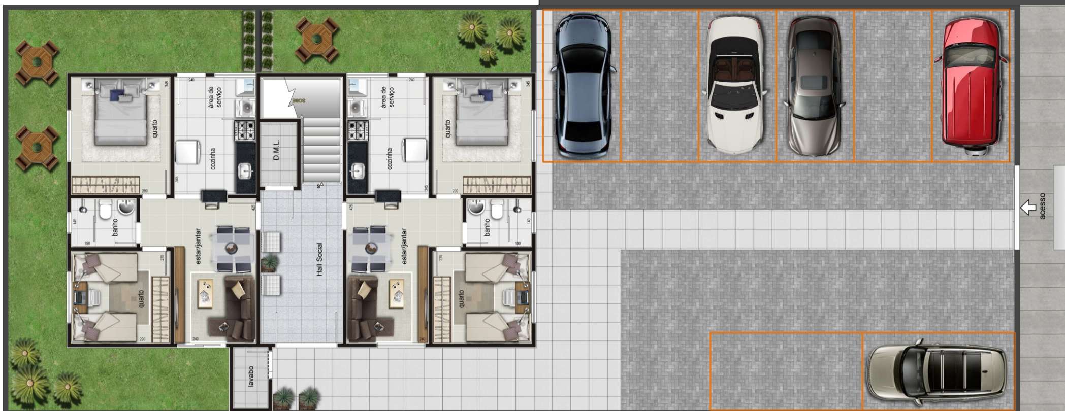
1º Pavimento com Área Privativa